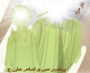
پیامبر ص و امام علی ع

دعوت به توحید دعوت به اخلاق دعوت به فطرت دعوت به تفکر و تعقل + علم