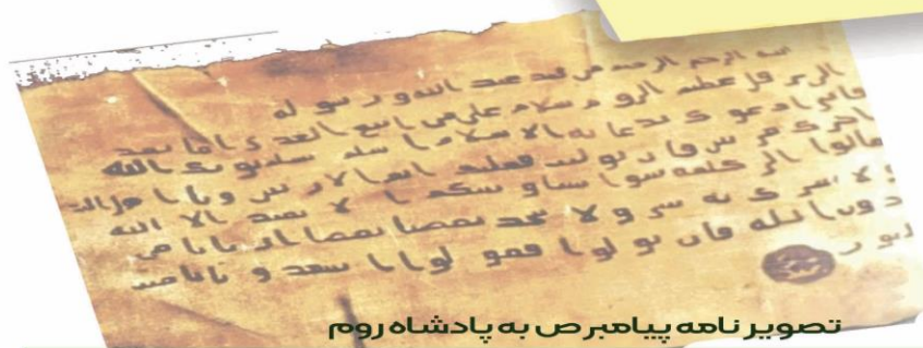
تصویر نامه پیامبرص به پادشاه روم